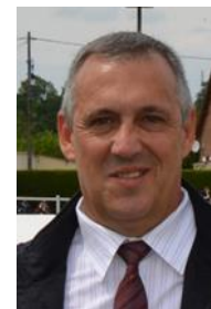
Secrétaire : Christophe SEREC