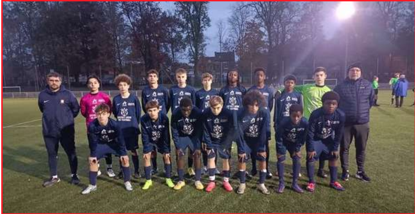
U15 G le 16/11/2025 à Liévin Matchs VS Flandres et Somme